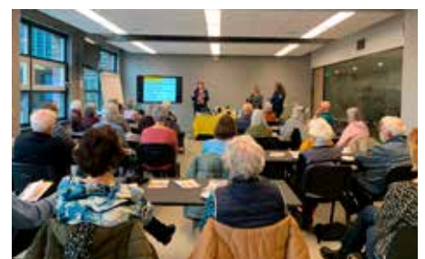
Voorlichting Evean: Gezond ouder worden

Alle activiteiten vinden in 2024 doorgang. Dit jaar is er ook de mogelijkheid om over de SMARTFloor te lopen, een mat die uw valrisico in kaart brengt. Verder zijn organisaties die nu nog niet zijn aangesloten bij de werkgroep van harte welkom. Meer weten? Neem dan contact op met Denice van Appeldoorn, via denicevanappeldoorn@dijkenwaardsport.nl .