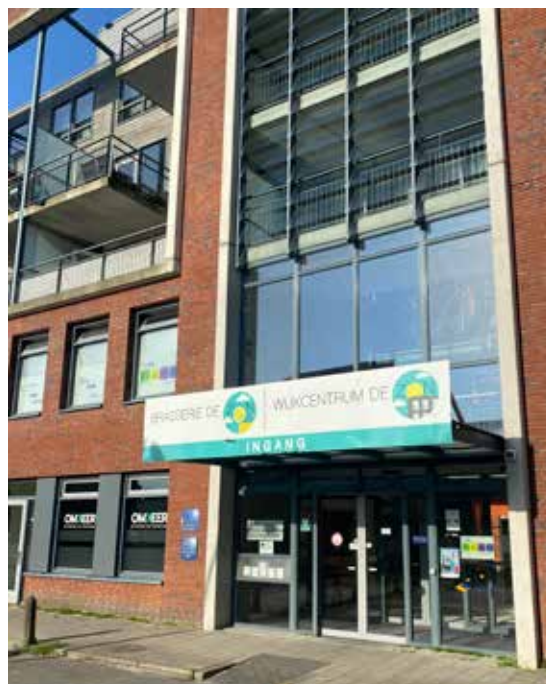
Wijkcentrum De Zon, Brandpunt 1 in Heerhugowaard

De Binding kunt u op maandag, dinsdag en donderdag binnenlopen tussen 9.00 en 12.00 uur voor een kopje koffie of thee. Of met uw verzoeken en vragen op welzijnsgebied. Trefpunt Rozenlaan is te bezoeken op maandag, woensdag en vrijdag tussen 9.00 en 12.00 uur.