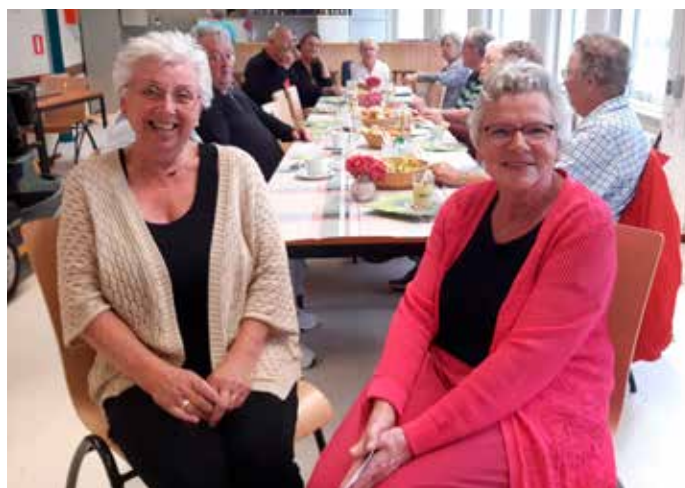
Gré en Ada met de lunchgroep

Qua voorgeschiedenis is er wel het een en ander aan voorafgegaan, maar uiteindelijk bleek de keuze voor een soort lunchcafé het best haalbare. "En dat eenmaal in de paar weken als onderdeel van de Doet & Ontmoet op donderdagmiddag", vertellen ze. "We hebben het op poten gezet, zonder dat we precies wisten of er animo voor was. Maar al gauw bleek dat er heel wat aanmeldingen kwamen. Het varieert nu tussen de tien en vijftien mensen. En dat is voldoende hoor. We houden het simpel en we hebben niet veel budget. Drie kadetjes per persoon en soms ook iets speciaals erbij: een eitje, krentenbol, slaatje of toetje. We hebben ook weleens – uiteraard thuis al – gehaktballen gedraaid. Dat viel erg