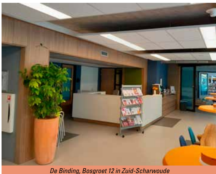
De Binding, Bosgroet 12 in Zuid-Scharwoude