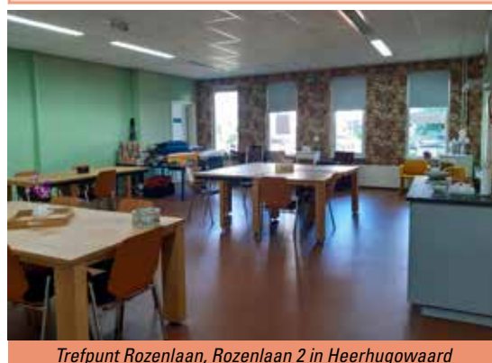
Trefpunt Rozenlaan, Rozenlaan 2 in Heerhugowaard